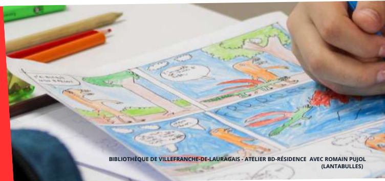
BIBLIOTHÈQUE DE VILLEFRANCHE-DE-LAURAGAIS - ATELIER BD-RÉSIDENTE AVEC ROMAIN PUJOL (LANTABULLES)